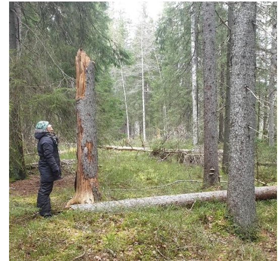
Svämskog vid Unnån.