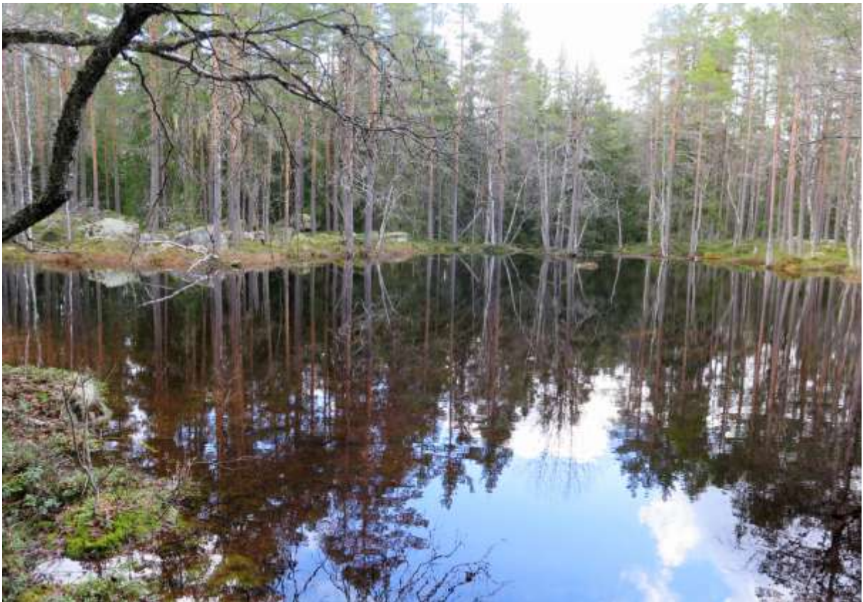
En av flera lokar.