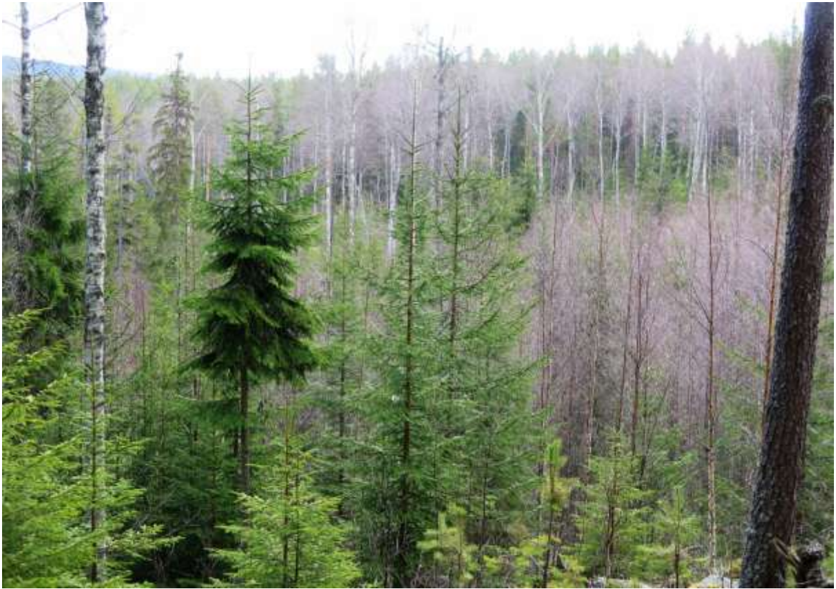
Lövrikt parti intill tallskogen.