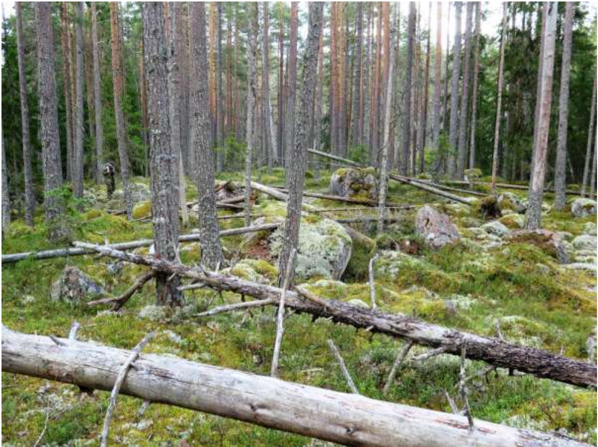
Självgallrad tallskog med angrepp av mindre märgborre. I området finns också lågor efter tidigare bränder.