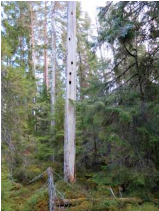
Grov torraka med spillkråkhål.