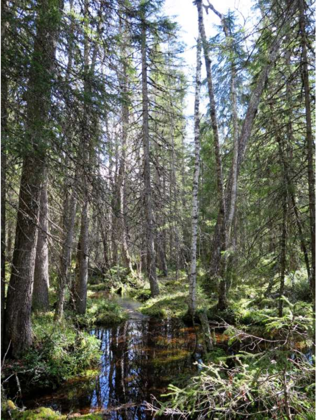
Klibbalkärr gränsar till tallskogen.