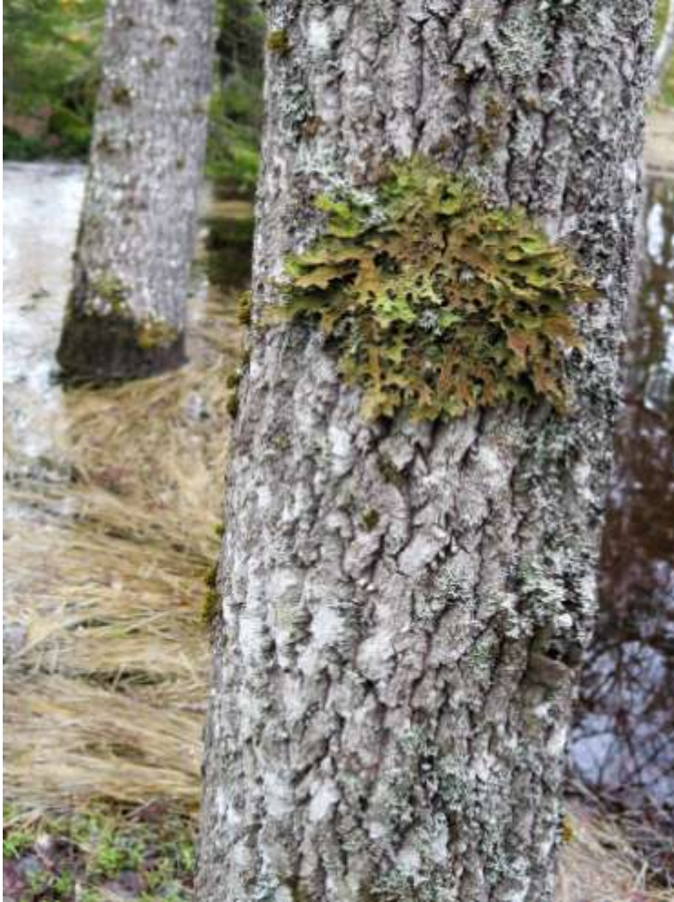
Lunglav på asp vid lok och några miljöbilder från området nedan.