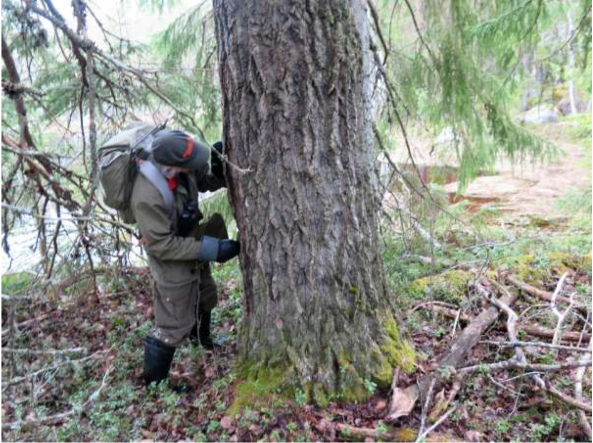
Grov asp vid två olika lokar.