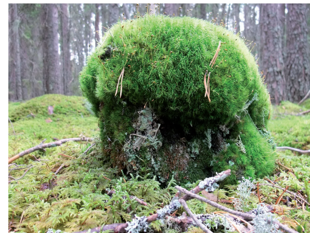
Mossbelupen stubbe i Skinnaränget.